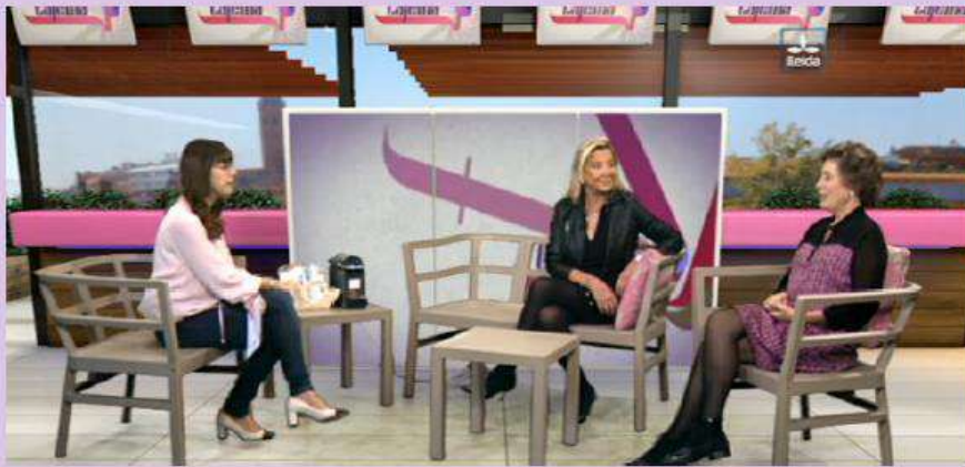
Lleida TV: "Programa Cafeïna"