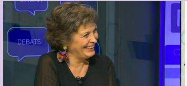
L'entrevista: Tv Girona